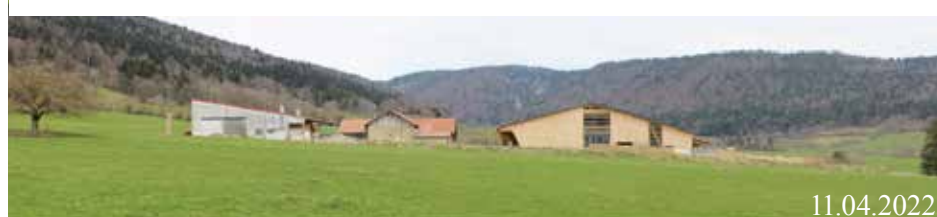
Le Pâquier, Le Côté