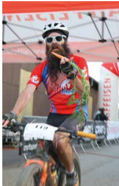
Une carotte à l'arrivée après l'effort.

Si la Raiffeisen Trans VTT réunit la crème des coureurs de la région, la course se veut avant tout populaire et les parcours sont tracés en conséquence; ils ne présentent aucune difficulté technique majeure. Et au moment de l'arrivée, à l'initiative du principal partenaire de l'événement, les coureurs sont tous récompensés par une carotte. Cela change de la pomme du BCN Tour! /pif