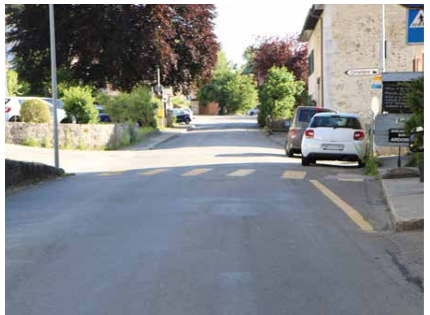
La traversée de Fenin va faire l'objet d'un réaménagement total.

cune procédure administrative ne vient freiner le début des travaux, le chantier s'ouvrira cet automne déjà. /pif