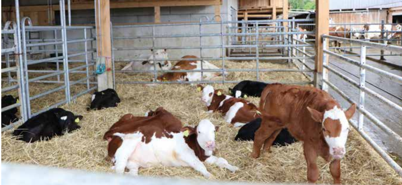
Une étable agrandie, rafraîchie et un box séparé pour les veaux (photo pif).

Le Domaine de l'Aurore à Cernier a fêté ses 25 ans dans le cadre du week-end portes ouvertes. Cet anniversaire coïncidait avec l'inauguration de son étable pour des vaches laitières-nourrices. La législation a changé: les veaux ne sont plus privés des pis de leur mère à la naissance.