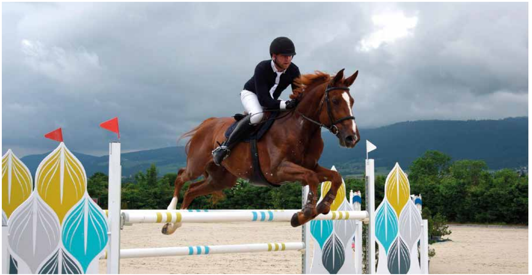
Le cheval était roi les 8 et 9 juin à Fenin. En raison d'un terrain détrempe, l'habituel concours hippique de la Société de cavalerie du Val-de-Ruz ne s'est pas tenu au Bois d'Engollon, mais sur le paddock de la famille Schneider.