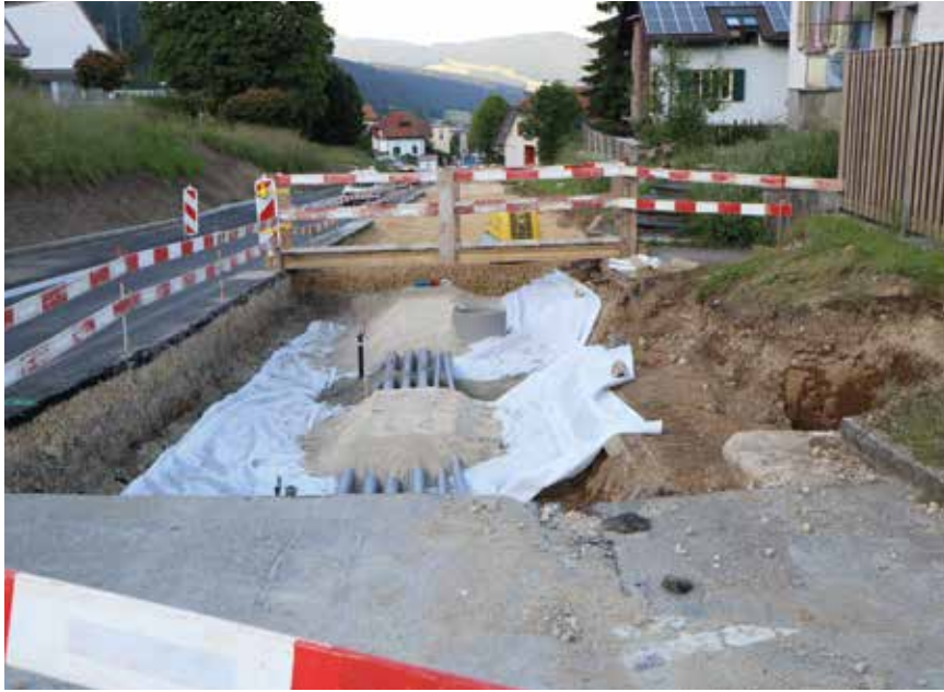
Si la météo le permet, les travaux de la traversée de Fontainemelon seront achevés à la fin de l'année.

Etat des lieux des chantiers routiers à venir, ou encore en cours, à Val-de-Ruz. Pour éviter de rouvrir un tronçon pour un oui ou pour un non, la coordination est essentielle au moment de planifier ce genre de travaux, qui ne concerne pas moins de neuf acteurs différents.