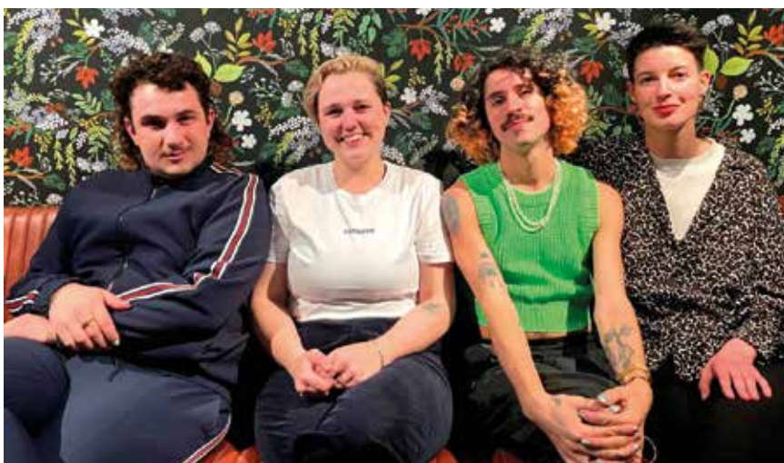
Trans*mission poétique: un spectacle qui questionne sur l'identité des genres.