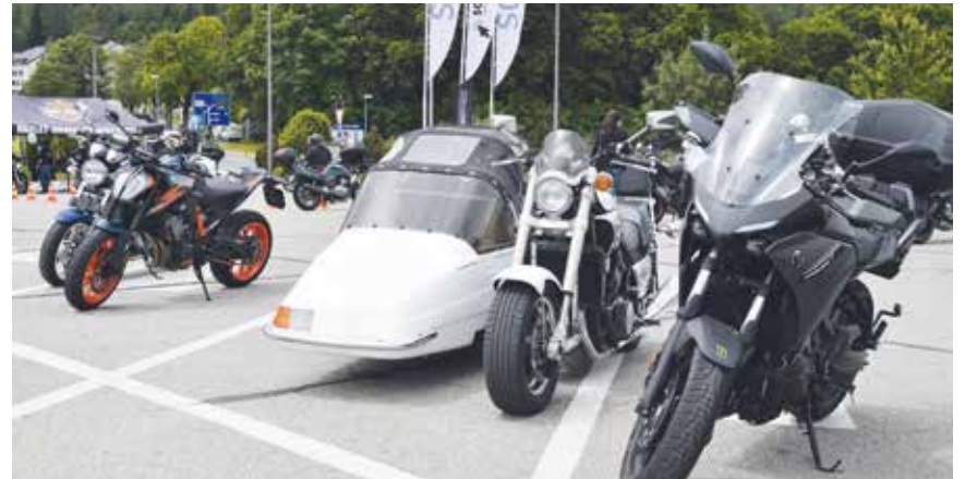
Il y en avait de tous les styles.

En 10 ans, la manifestation semble désormais bien établie. Cette journée constitue en effet une bonne occasion de se rencontrer, de partager sa passion, parce que la moto reste, bien plus que la voiture, une affaire de passionnés. /pif-comm