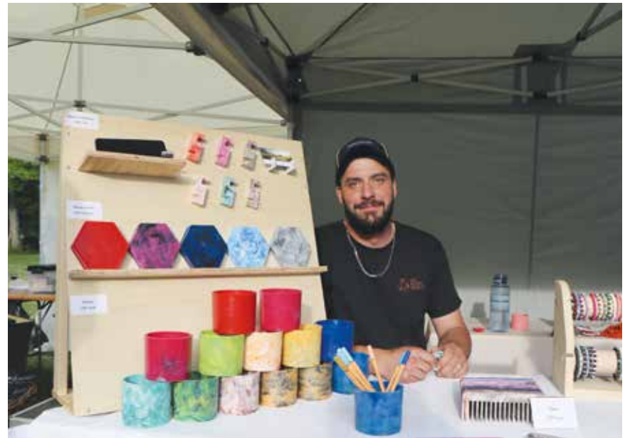
Des objets issus de la récupération de bouchons en plastique.